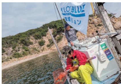
香川県タケノコメバル