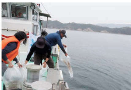
広島県クロメバル