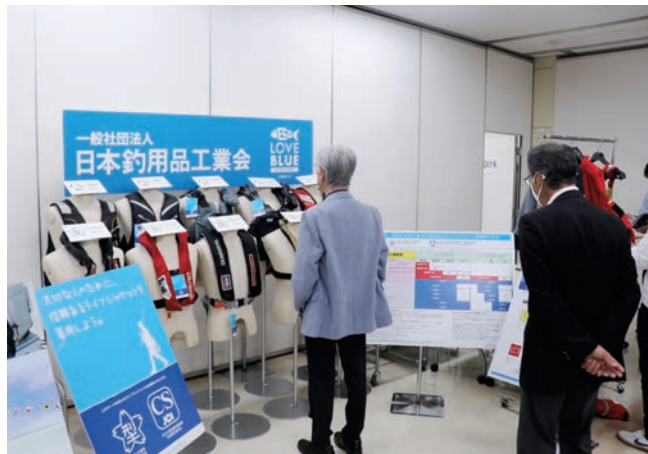
桜マーク・CSマークの信頼あるLJの展示