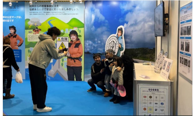
<マルコスさん サイン・撮影会>