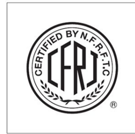
＜実施当日に投稿いただいたマーク＞