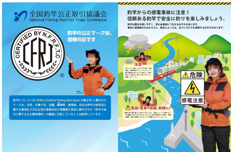
<釣竿公正マーク・釣竿からの感電事故防止 PR>