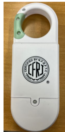
<アンケート回答の様子 ・ 公正マークノベルティプレゼント>