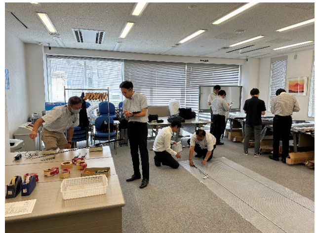
＜会員対象調査の様子＞