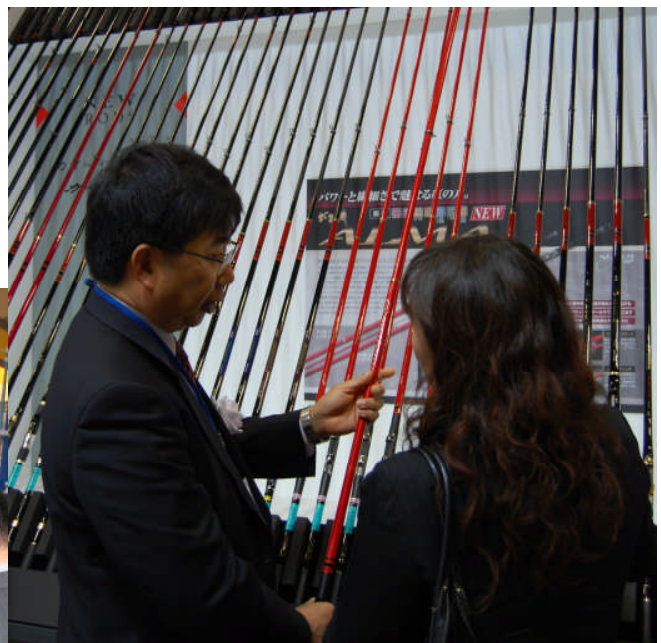
←全国釣竿公正取引協議会ブース